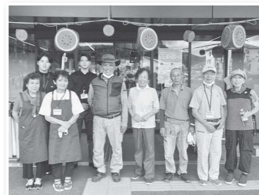
病院ボランティアの皆さんと職員