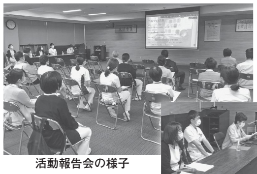
活動報告会の様子

今回の報告会はオンラインでつなぎ、町立奥出雲病院からも多くの職員が参加がありました。今後も、当院だけでなく、雲南圏域間の連携強化を図り、さらなる看護の質向上に向けた活動を推進していきます。