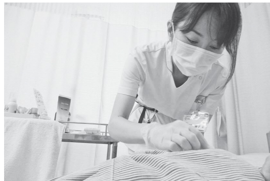
▲病室での皮膚処置の様子

他には外来でストーマケアも行っています。排泄の経路が変わることによって、さまざまな悩みや問題が起こってきます。これからストーマの手術を受ける方に、身体的・精神的な支援を中心に行っています。ストーマとは何かを理解できるように説明し、疑問や不安の軽減をしていきます。そして術後には自分らしい日常生活を取り戻せるように支援しています。