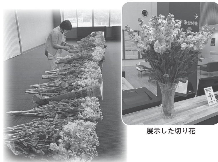
いただいた切り花