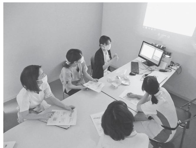
▲職員に対する勉強会

そして皮膚の問題だけではなく、排泄に関して「自分で完結したい」と願う方の気持ちにも応えたいと思っています。しかし、認定看護師が一人で対応するには限界があります。他の医療スタッフと協力し、一人ひとりの患者に寄り添ったケアを提供していきたいと思っています。