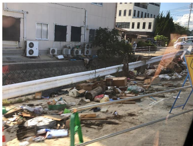
図 2：河川氾濫による土砂やがれき：左：三原市内で JR の線路が土砂で埋まっていた様子；右：沼田西町民センター避難所周囲の様子