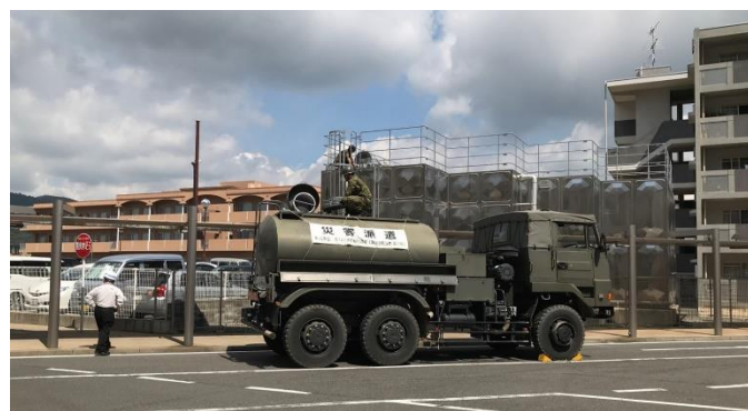
図 1：自衛隊給水車(尾道市立病院)

建物の被害はなくライフラインは電気・ガスは正常だが、水道は断水していたため、自衛隊や市水道局から確保しているが、3 日あるかどうかの状況であった（図 1）。食料は備蓄が 3 日あり、備蓄を使用しなくても 1 週間程度は確保されていた。手術制限や歯科外来中止などの診療制限を行い、透析患者は搬送困難な 2 名を除いて 26 名を福山市へ搬送して対応されていた。また水制限のため水冷式空調を使用せず、80 名は冷房が使用できない状態であった。現時点では院内での対応で可能であり、病院避難は検討されていなかったため、その旨を本部に報告した。