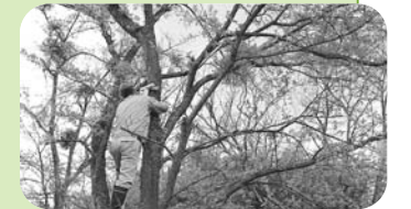
▲桜のヤドリギ取り