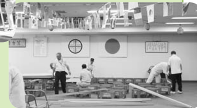
▲七夕コンサートの舞台準備