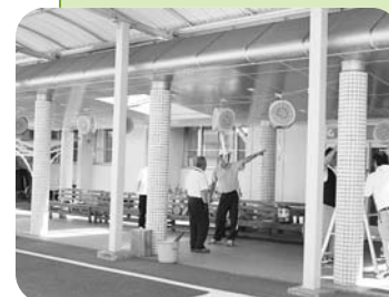
▲正面玄関のスイカちょうちん飾り