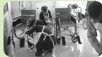
▲車イス点検・清掃の様子

患者さんが利用される車イスを点検し、タイヤに空気が入っているか、補修が必要な箇所はないかなど1台1台丁寧に作業をしていただきました。この日は隠岐病院のボランティアの会「菊の会」から4人の方が作業に参加され、作業後の意見交換会では活発な意見交換があり、「今後も交流の場を持ち、お互いの励みになると良い」との感想がありました。