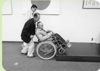
▲実際の訓練の様子