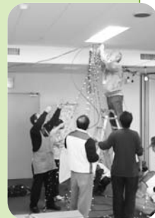
▲電飾ツリーの取付け