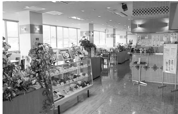
▲オランジュ店内の様子

場所：雲南市立病院 南棟5階 営業時間：10:30～17:00 定休日：土、日、祝日