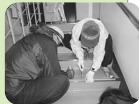
▲新しいゴムの交換

病院内のすべての階段の滑り止めの補修作業を行っていただきました。滑りやすくなったいたゴムを交換して、安心して階段を使うことができるようになりました。