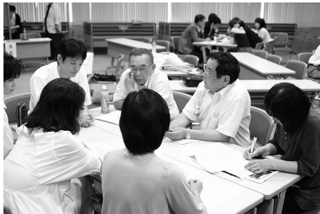
▲事例を検討する参加者