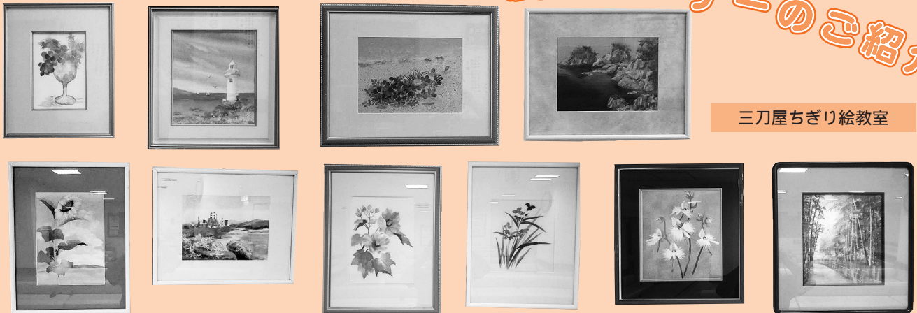
三刀屋ちぎり絵教室