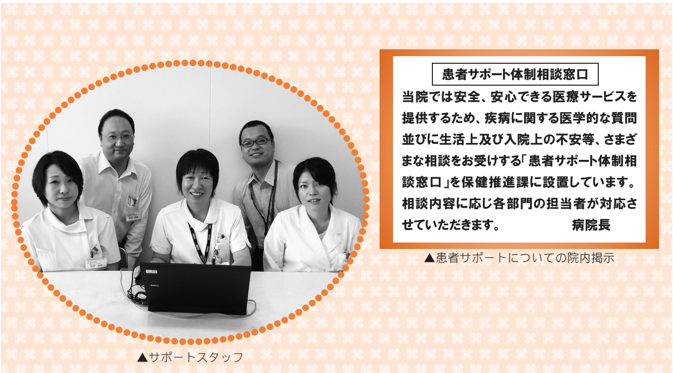
▲サポートスタッフ