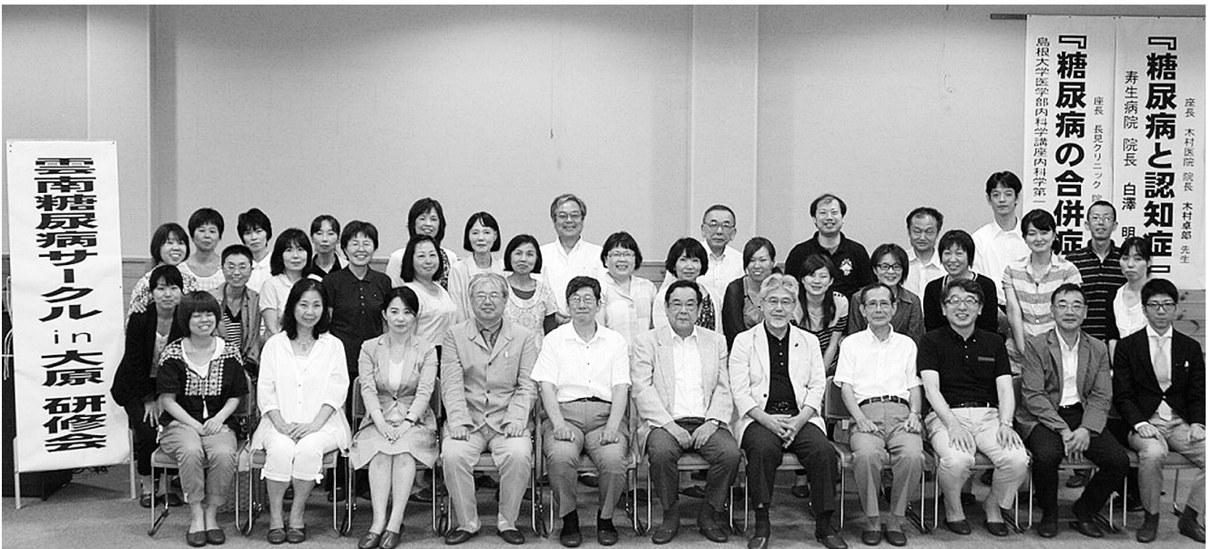
▲研修会終了後に記念撮影