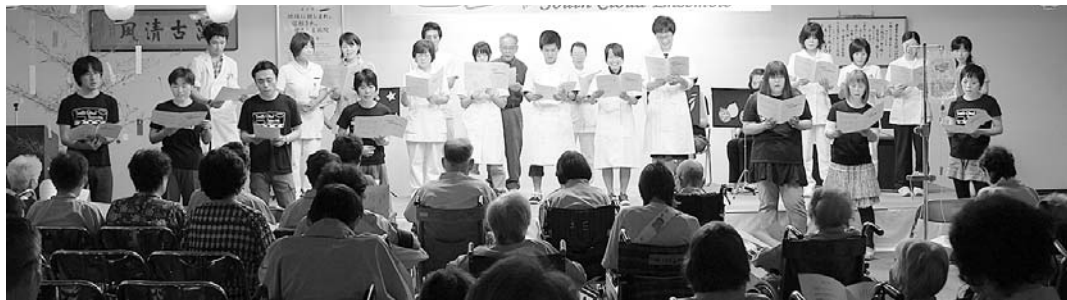
▲会場のみなさんと一緒に合唱

による「川の流れるように」、「星のフラメンコ」の演奏があり、次に「花は咲く」の歌を披露しました。その後合唱に移り、「七夕さま」や「ふるさと」などを会場のみなさんと一緒に歌い楽しいひと時となりました。最後に、島根大学医学部地域枠・緊急医師確保枠推薦入試受験予定者の松江南高校・常総学院の生徒4人が急遽自発的にステージに上がり、会場のアンコールに呼んで歌うというサプライズがありました。 コンサートを聴きに来られた患者さまからは、「心に響きとても穏やかになりました。明日からまた頑張りたいと思います」、「久しぶりに声を出して歌えて良かったです」などの感想があり、大盛況でした。