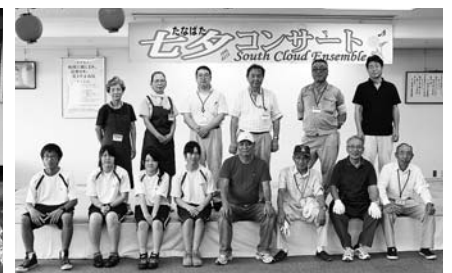
▲七夕の準備をしてくださったみなさん