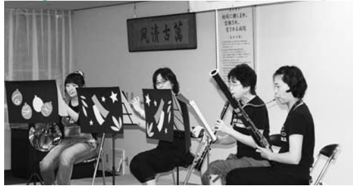
▲アンサンブルによる演奏

8月2日に当院で七夕コンサートを開催しました。職員有志による音楽友の会「South Cloud Ensemble」（サウスクラウド アンサンブル）の主催で行われ、入院中の患者さまなど約130人が参加しました。 オープニングは、「ありがとう」の合唱でスタートし、その後、クラリネット・ホルン・ファゴット・フルートのアンサンブル