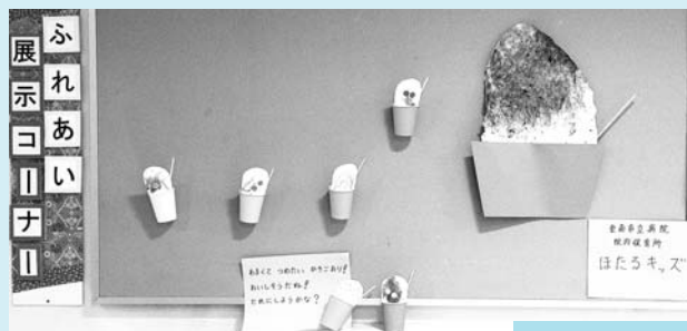
院内保育所「ほたるキッズ」