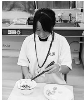
▲クリップ箸でのリハビリ体験