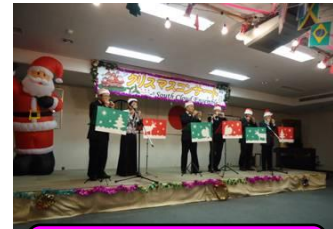
雲南チェリーズの皆様によるハーモニカ演奏