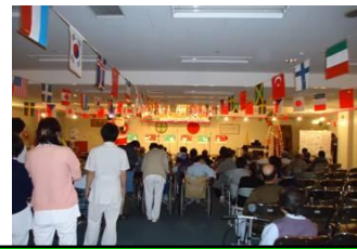
会場の様子: 沢山の患者さん

「開演されたコンサートでは、職員有志で結成している音楽サークル波サウス・クラウド・アンサンブルと、雲南チェリーズの人々による演奏が盛り上げて頂きました。」