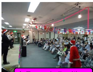
全員での合唱の様子