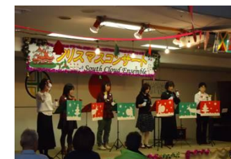
サウクラによるハンドベル演奏

最後の合唱の前にはサンタクロースとトナカイの扮する先生方から患者さん達へ歌詞カードの配布を行い、皆で合唱を盛んに行いました。