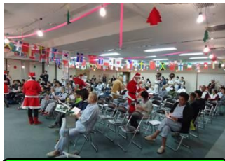
サンタとトナカイに扮し歌詞

最後の合唱の前にはサンタクロースとトナカイの扮する先生方から患者さん達へ歌詞カードの配布を行い、皆で合唱を盛んに行いました。