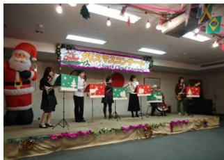
サウクラによる管楽器演奏