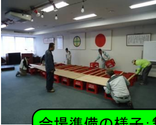
会場準備の様子: 舞台・看板の設置、照明の取付、椅子の配置等、全員が汗だく

12月17日の院内美化作業はクリスマスコンサート準備を行いました。コンサート当日の準備作業となり慌しい中での作業でしたが、皆様のご協力により素晴らしい舞台が完成しました。