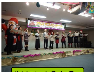
サウクラによる合唱