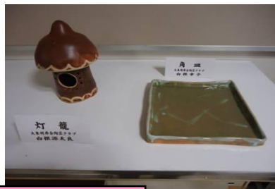
大東明寿会 陶芸 作品