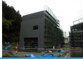
エネルギー棟の外観