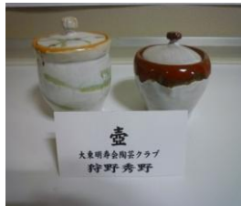
壺 狩野 秀野