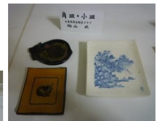
角皿・小皿 陶山 武