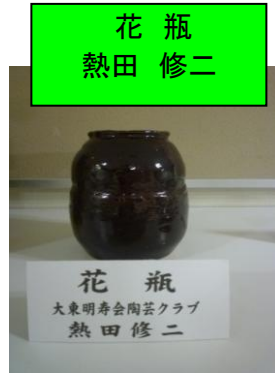
花瓶 熱田 修二