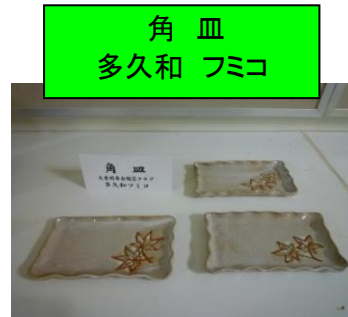
角皿 多久和 フミコ