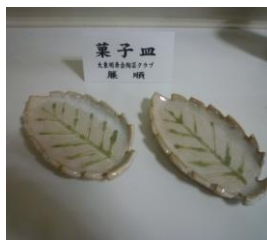
菓子皿 簾 順