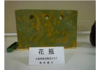
花瓶 飛田 禮介