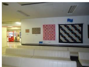
木次人権センター 文化教養教室 パッチワーク