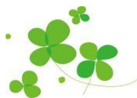
吉田書道教室 開眼端光支部