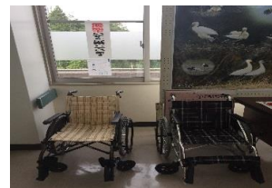
ボランティア展示ブース