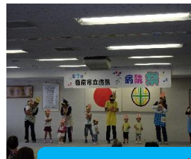
ほたるキッズの園児によるダンス