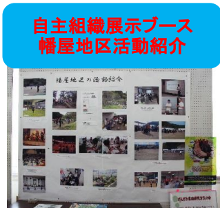
自主組織展示ブース 幡屋地区活動紹介