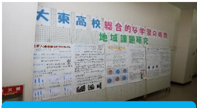
大東高校地域課題研究

その他にもメイン会場では、ほたるキッズの園児によるダンス、戦隊ショーなど来場者を楽しませていただきました。