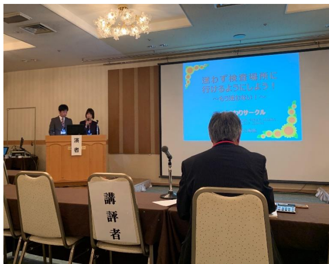
図 1：全国大会での発表

1) 雲南市立病院看護科、2) 雲南市立病院 ひまわりサークル、3) 雲南市立病事務部総務課、4) 雲南市立病事務部企画財政課